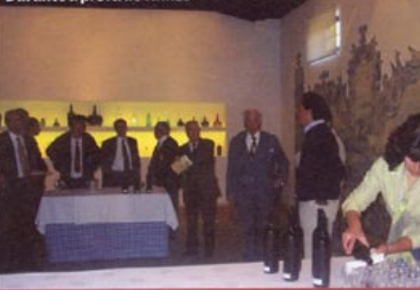
Durante a prova de vinhos